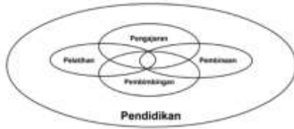
Gambar 1. Hubungan Pendidikan dengan BK

Berdasarkan gambar 1 bahwa konteks Pendidikan memiliki beberapa esensi seperti pembimbingan, pelatihan, pengajaran, dan pembinaan. Pemberian bimbingan dan layanan konseling merupakan tanggung jawab dalam upaya membangun capacity building peserta didik untuk memiliki keterampilan mengambil keputusan ( decision making ) sehingga dapat memecahkan berbagai persoalan. Maka, layanan BK menjadi tugas yang harus dijalankan oleh guru sebagai upaya untuk memaksimalkan perkembangan potensi peserta didik (Syafaruddin et al, 2019).