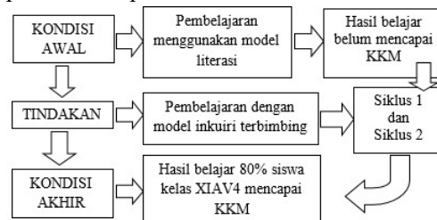
Gambar 1. Kerangka berpikir

Berdasarkan dukungan landasan teoritik yang diperoleh dari eksplorasi teori yang dijadikan rujukan konsepsional variabel penelitian, maka dapat disusun kerangka berpikir penelitian seperti dalam Gambar 1 berikut ini: