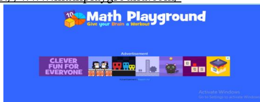
Gambar 1 Tampilan Awal Math Playground

Math Playground merupakan platform web interaktif yang didesain khusus untuk menyenangkan dan menarik siswa dalam belajar matematika. Situs ini menyediakan berbagai macam permainan matematika, simulasi, dan aktivitas interaktif yang dirancang untuk meningkatkan pemahaman siswa tentang konsep matematika (Gusteti et al., 2023). Math Playground juga memiliki sumber daya belajar, seperti video pembelajaran dan daftar topik matematika, yang dapat membantu siswa memperdalam pemahaman mereka tentang konsep-konsep matematika yang lebih kompleks. Math Playground bertujuan untuk menciptakan pengalaman pembelajaran matematika yang menyenangkan dan menarik bagi siswa, sehingga meningkatkan motivasi mereka dalam belajar dan terus bersemangat dalam mempelajari matematika. (Lukum, 2019) Situs web yang dirilis pada tahun 2002 tersebut memuat tidak kurang dari 133 game matematika daring yang diperuntukkan bagi siswa kelas 1 sampai dengan kelas 6 (Wibowo, 2020). Sejak pertama kali dirilis situs web tersebut telah tumbuh dan semakin variatif karena mencakup topik matematika yang luas, mulai dari pemecahan masalah, matematika dalam dunia nyata dan game berpikir. Kelebihan situs web tersebut adalah sebagian besar game yang disajikan sudah memberikan umpan balik yang cukup memadai. Situs math playground ini dapat dikunjungi melalui link berikut https://www.mathplayground.com/