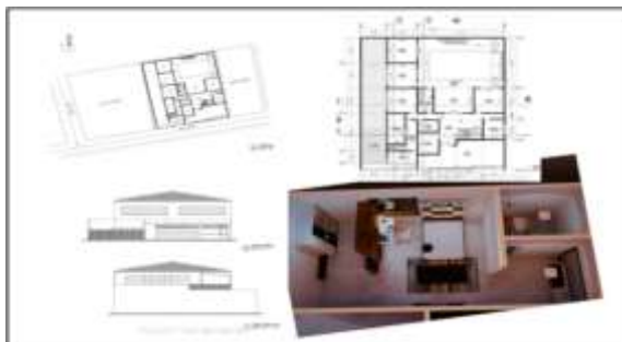
Gambar 2. Hasil Konsep Perencanaan Awal

Setelah konsep perencanaan selesai disusun, langkah selanjutnya adalah mewujudkan konsep tersebut menjadi sebuah gambar desain arsitektur. Peserta didik dalam perannya sebagai seorang perencana harus dapat menyajikan ide dan gagasannya menjadi sebuah tampilan visual berupa gambar. Gambar-gambar yang dimaksud adalah: (1) gambar site plan , (2) gambar denah, (3) gambar tampak, (4) gambar 3 dimensi. Pada tahap ini, ada proses diskusi antara owner/pemilik dengan perencana untuk menyamakan persepsi terhadap konsep perencanaan yang sudah disusun. Gambar 2 di bawah ini adalah salah satu hasil proyek pada tahap konsep perencanaan awal.