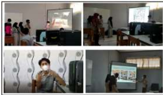
Gambar 4. Presentasi Proyek

sehingga menghasilkan karya final dari proyek ini. Pada gambar 4 berikut ini adalah situasi ketika kegiatan presentasi berlangsung.