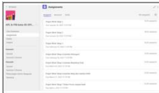
Gambar 7. Tangkapan Layar Kelas Teams XII DPIBB

Beberapa hasil karya peserta didik yang berupa gambar 3 dimensi, terlihat pada gambar 8 dan gambar 9 berikut ini: