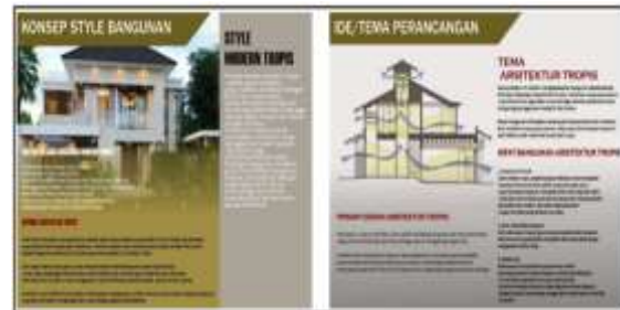
Gambar 5. Infografis Konsep Perencanaan Rumah Tinggal

dalam penugasan yang ada di kelas teams dari office 365. Semua kelompok dapat menyelesaikannya dengan baik. Gambar 5 di bawah ini adalah salah satu infografis konsep perencanaan karya peserta didik.