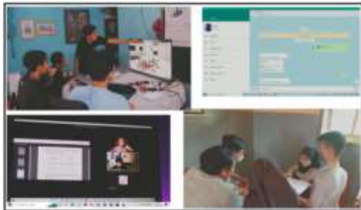
Gambar 1. Diskusi Kelompok

Peserta didik bekerja sama dalam kelompok, melakukan literasi mandiri tentang mendesain rumah tinggal dan gambar desain interior, dari berbagai sumber, kemudian berdiskusi untuk menyusun konsep rumah tinggal yang direncanakan. Pada tahap diskusi dan literasi mandiri ini, guru berperan sebagai pendamping dan fasilitator, selalu melihat kemajuan proyek peserta didik. Pendampingan dan pemantauan dilakukan secara luring dalam pembelajaran tatap muka terbatas maupun secara daring melalui kelas teams dan pesan whatsapp . Diskusi dan kerja kelompok dapat dilakukan secara daring dengan WhatsApp grup maupun secara tatap muka ketika Pembelajaran Tatap Muka Terbatas (PTMT) di sekolah atau berkumpul di rumah salah satu anggota kelompok. Gambar 1 berikut ini adalah kegiatan peserta didik ketika berdiskusi untuk menyusun konsep rumah tinggal yang nyaman.