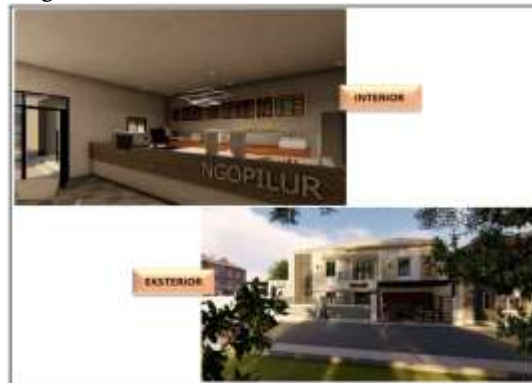
Gambar 8. Gambar 3 Dimensi Hasil Project Work

Beberapa hasil karya peserta didik yang berupa gambar 3 dimensi, terlihat pada gambar 8 dan gambar 9 berikut ini: