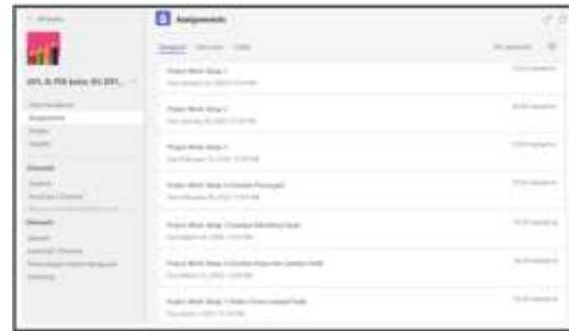
Gambar 6. Tangkapan Layar Kelas Teams XII DPIBA

dalam kelas teams. Gambar 6 adalah tangkapan layar kelas XII DPIBA dan gambar 7 adalah tangkapan layar kelas XII DPIBB.