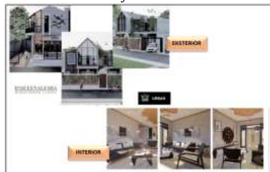
Gambar 9. Gambar 3 Dimensi Hasil Project Work