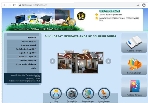
Gambar 2. Pengelolaan perpustakaan berbasis teknologi informasi

Kegiatan otomasi perpustakaan dilakukan dengan memasang Software IBRA V8 dalam kegiatan pengelolaan perpustakaan yang meliputi sirkulasi, pendataan pengunjung dan pendataan katalog dapat terlihat pada Gambar 2 di bawah ini.