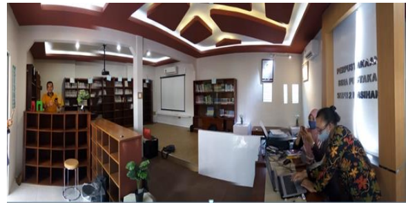
Gambar 1. Ruang depan perpustakaan

sering berkunjung ke perpustakaan karena kenyamanan interior perpustakaannya. Kenaikan kualitas interior Perpustakaan SMP Negeri 2 Kasihan dapat dilihat pada Gambar 1 berikut ini.