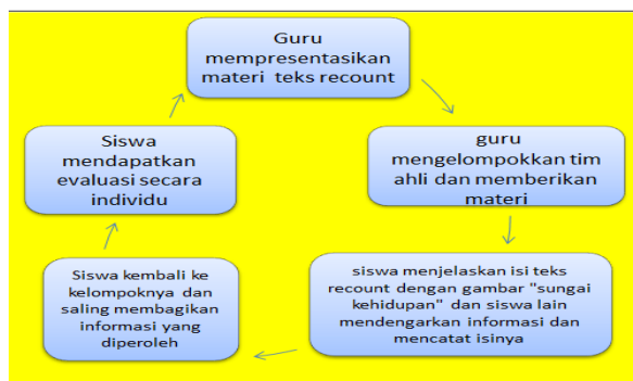
Gambar 1 Pelaksanaan Model Pembelajaran Jigsaw pada Siklus I dan Siklus II

Berdasarkan kegiatan pembelajaran yang dilakukan siklus I dan siklus II dapat disimpulkan dalam gambar 1 model pembelajaran Jigsaw berikut ini.