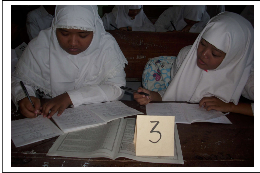
Gambar 1. Aktivitas siswa dalam diskusi kelompok kecil, setiap kelompok terdiri atas 5 (lima) siswa

Dari kegiatan ini siswa dapat memperoleh pengetahuan baru dengan menemukan dan mengalami sendiri. Setelah didapatkan informasi secara lengkap dari berbagai sumber pustaka, selanjutnya informasi tersebut didiskusikan bersama teman-teman dalam satu kelompok. Dalam kelompok tersebut pula mereka melakukan analisis berbagai informasi yang diperoleh, kemudian merumuskan dalam bentuk sebuah makalah yang berisikan antara lain: jenis-jenis konflik antarpelajar, penyebab konflik antarpelajar, perbedaan konflik dengan anarkis, cara penyelesaian konflik antarpelajar, dan dampaknya terhadap kehidupan bermasyarakat sehari-hari.