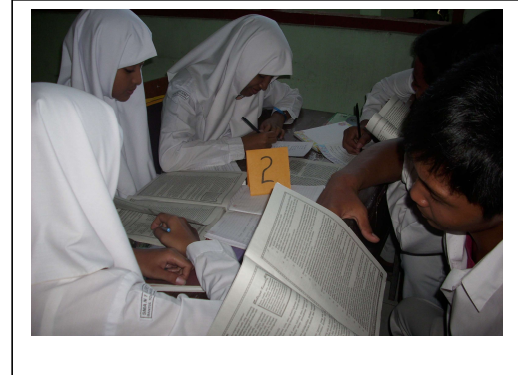
Gambar 2. Foto aktivitas siswa dalam diskusi kelas, salah satu kelompok mempresentasikan hasil penelitian kelompoknya di depan kelas dan kelompok lainnya menanggapi

melalui penelitian diskusi ( sharing ). Selain itu, diskusi juga merupakan sarana (media) untuk saling tukar pendapat sehingga memperkaya pemahaman siswa terhadap penyebab konflik mengembangkan alternatif pemecahan (pengembangan kreativitas siswa).